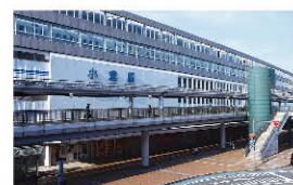
■ JR小倉駅 3,300m(車で約5分)