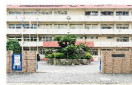
■ 小倉西高等学校 430m(徒歩約6分)