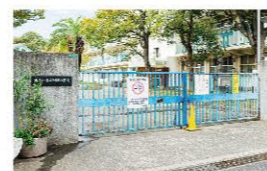
■ 到津小学校 520m(徒歩約7分)