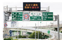
■ 都市高速「下道津入口」 490m(車で約1分)