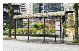
■ 西鉄バス「小倉北特別支援学校」停 60m(徒歩約1分)