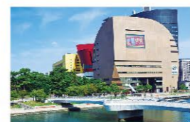
■ リバーウォーク北九州 2,200m(車で約4分)