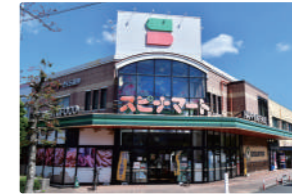
スピナマート さくら通り店 …180m (徒歩約3分)