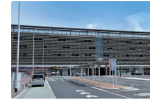
JR八幡駅 …680m (徒歩約9分)

※徒歩所要時間表示は分速80m、車による所要時間表示は時速40kmで算出しております。