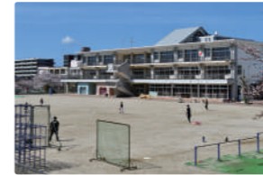
北九州市立花尾小学校 …200m (徒歩約3分)